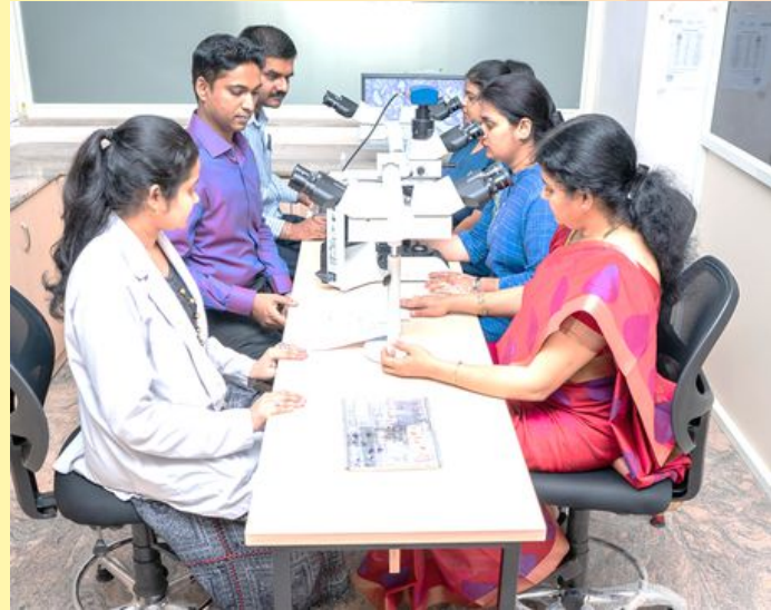
ದಂತ ವಿಜ್ಞಾನಗಳ ವಿಭಾಗ, ಎಂ. ಎಸ್. ರಾಮಯ್ಯ ಅನ್ವಯಿಕ ವಿಜ್ಞಾನಗಳ ವಿಶ್ವವಿದ್ಯಾಲಯ, ನ್ಯೂ ಬಿಇಎಲ್ ರಸ್ತೆ, ಎಂ.ಎಸ್.ಆರ್. ನಗರ, ಬೆಂಗಳೂರು - 560054

ಬಾಯಿ, ಮುಖ ಮತ್ತು ಡವಡೆಯ ರೋಗ ಲಕ್ಷಣ ಹಾಗೂ ಸೂಕ್ಷ್ಮ ಜೀವವಿಜ್ಞಾನ ವಿಭಾಗವನ್ನು 1992ರಲ್ಲಿ ಸ್ಥಾಪಿಸಲಾಯಿತು. ಈ ವಿಭಾಗವು ಪೂರ್ವಸ್ನಾತಕ, ಸ್ನಾತಕೋತ್ತರ, ಮತ್ತು ಪಿಎಚ್.ಡಿ ಸಂಶೋಧನಾ ವಿದ್ಯಾರ್ಥಿಗಳಿಗೆ ಅತ್ಯುತ್ತಮ ಶೈಕ್ಷಣಿಕ ತರಬೇತಿಯನ್ನು ಒದಗಿಸುತ್ತದೆ. ಇದು ಅತ್ಯುತ್ತಮ ರೋಗಿ ಆರೈಕೆಯನ್ನು ನೀಡುತ್ತಿದ್ದು, ವಿವಿಧ ರೀತಿಯ ಸೇವೆಗಳನ್ನು ಒದಗಿಸುತ್ತದೆ. ಈ ವಿಭಾಗವು ನಿಯಮಿತ ರಕ್ತ ಪರೀಕ್ಷೆಗಳು, ಬಯಾಪ್ಟಿ ವರದಿಗಳು ಹಾಗೂ ಕೆಲವು ಉನ್ನತ ಮಟ್ಟದ ರೋಗನಿರ್ಣಯ ಸಹಾಯಗಳಂತಹ ಪ್ರಯೋಗಾಲಯ ಸೌಲಭ್ಯಗಳನ್ನು ಒದಗಿಸುವ ಮೂಲಕ ದಂತ ವೈದ್ಯಶಾಸ್ತ್ರದ ಇತರ 8 ವಿಶೇಷತೆಗಳಿಗೆ ಸಹಕಾರ ನೀಡುತ್ತದೆ. ಇದರಿಂದ ಬಾಯಿ, ಮುಖ ಮತ್ತು ಡವಡೆಯ ಪ್ರದೇಶದಲ್ಲಿನ ವಿವಿಧ ಅನಾಮಾನ್ಯತೆಗಳ ನಿಖರ ನಿರ್ಣಯ ಸಾಧ್ಯವಾಗುತ್ತದೆ. ಈ ವಿಭಾಗವು ಅತ್ಯಂತ ಉತ್ಕೃಷ್ಟತೆ ಮತ್ತು ಸಂಶೋಧನಾ ಮನೋಭಾವ ಹೊಂದಿರುವ ಸಿಬ್ಬಂದಿಗಾಗಿ ಪ್ರಸಿದ್ಧವಾಗಿದ್ದು, ಅವರು ಅನುವಾದಾತ್ಮಕ (ಟ್ರಾನ್ಸ್‌ಲೇಷನಲ್) ಮೌಲ್ಯದ ಉತ್ತಮ ಸಂಶೋಧನಾ ಯೋಜನೆಗಳನ್ನು ಕೈಗೊಂಡಿದ್ದಾರೆ. ಈ ವಿಭಾಗದಲ್ಲಿ ಬಾಯಿಯ ಕ್ಯಾನ್ಸರ್ ಮತ್ತು ಸಂಶೋಧನಾ ಕೇಂದ್ರ ಕೂಡ ಇದ್ದು, ಇದು ಬಾಯಿ ಕ್ಯಾನ್ಸರ್ ನಲ್ಲಿ ಬಹುವಿಷಯಕ ಚಿಕಿತ್ಸಾ ಮತ್ತು ಅನ್ವಯಿತ