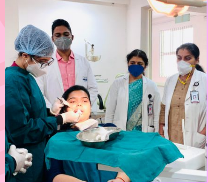
ದಂತ ವಿಜ್ಞಾನಗಳ ವಿಭಾಗ, ರಾಮಯ್ಯ ಅನ್ವಯಿಕ ವಿಜ್ಞಾನಗಳ ವಿಶ್ವವಿದ್ಯಾಲಯ